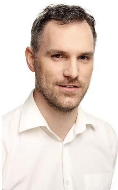
MUDr. Zdeněk Hřib